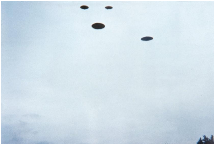
27 februari 1975, kl. 10.03 Jakobsberg-Allenberg/Bettswil-Bäretswil