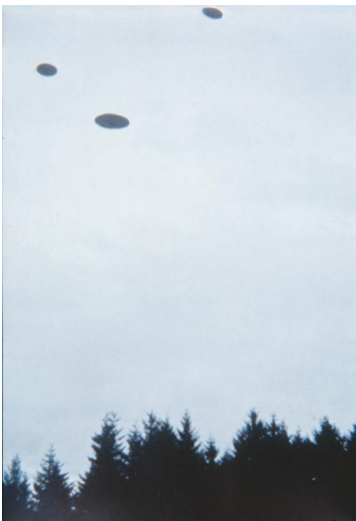
27 februari 1975, kl. 10.04 Jakobsberg-Allenberg/Bettswil-Bäretswil