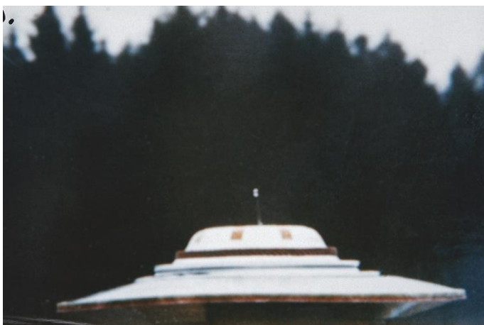
27 februari 1975, kl. 16.04 Jakobsberg-Allenberg/Bettswil-Bäretswil

Semjases strålskepp har landat för demonstrationsändamål. Kamerans sökare exploderade på grund av att fartyget kom för nära.