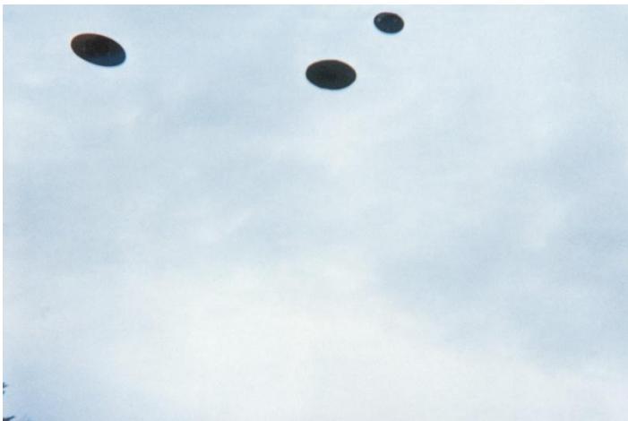
27 februari 1975, kl. 10.04 Jakobsberg-Allenberg/Bettswil-Bäretswil