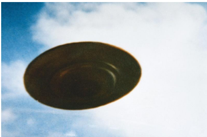
27 februari 1975, kl. 16.00 Jakobsberg-Allenberg/Bettswil-Bäretswil

Demonstrationsflygning med Semjases nya strålskepp som tillkännagavs den 25 februari. Närbild underifrån.