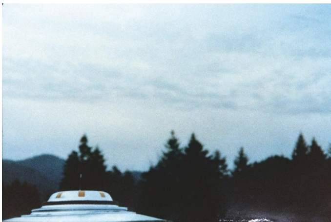
27 februari 1975, kl. 16.05 Jakobsberg-Allenberg/Bettswil-Bäretswil

Semjases strålskepp har landat för demonstrationsändamål. Kamerans sökare exploderade på grund av att fartyget kom för nära.