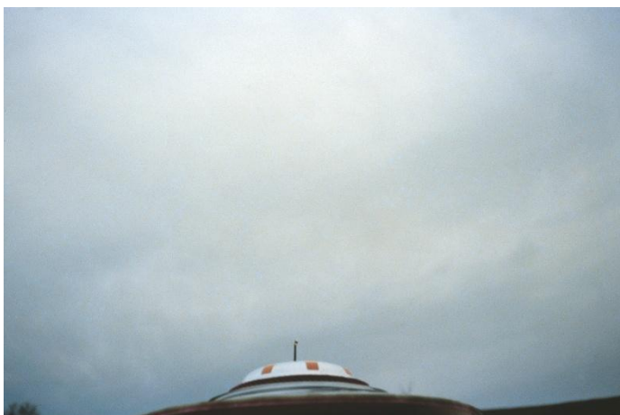
27 februari 1975, kl. 16.02 Jakobsberg-Allenberg/Bettswil-Bäretswil

Demonstrationsflygning med Semjases nya strålskepp som tillkännagavs den 25 februari. Närbild underifrån.