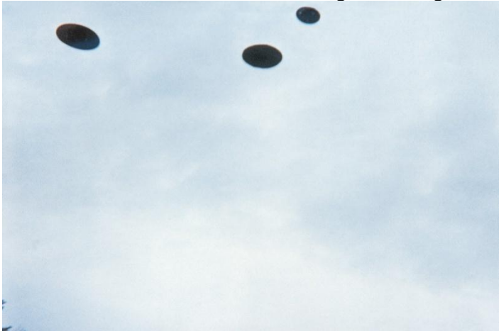
27. Februar 1975, 10.04 h Jakobsberg-Allenberg/Bettswil-Bäretswil