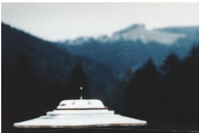
27 februari 1975, kl. 16.00 Jakobsberg-Allenberg/Bettswil-Bäretswil

Semjases strålskepp har landat för demonstrationsändamål. Kamerans sökare exploderade på grund av att fartyget kom för nära.